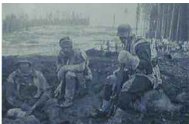
Talvisodan sotilaat lepäämässä rintamalla